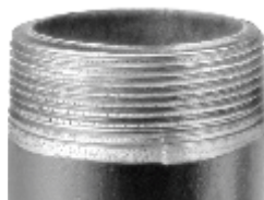
Rosqueado com Cossinets de Aço Rápido do Concorrente