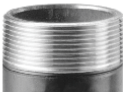
Rosqueado com Cossinets RIDGID "GOLD"